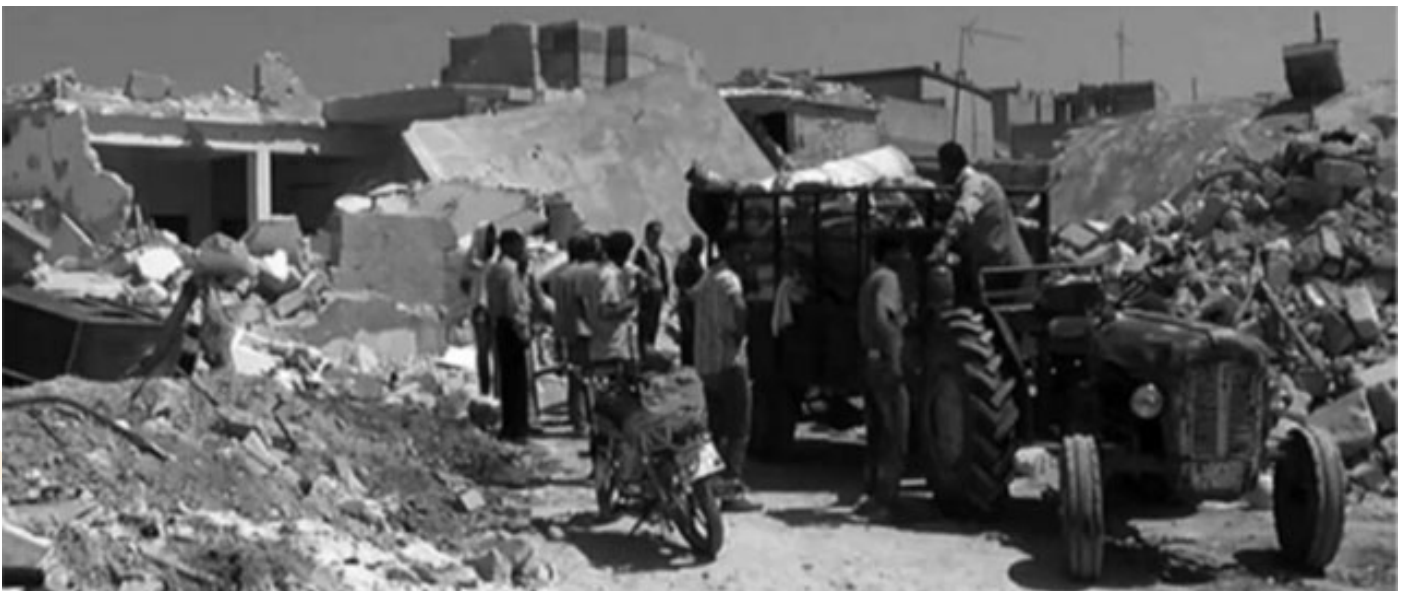
الشكل (3): آثار ما بعد القصف الجوي من قبل قوات النظام على إعزاز 2012.