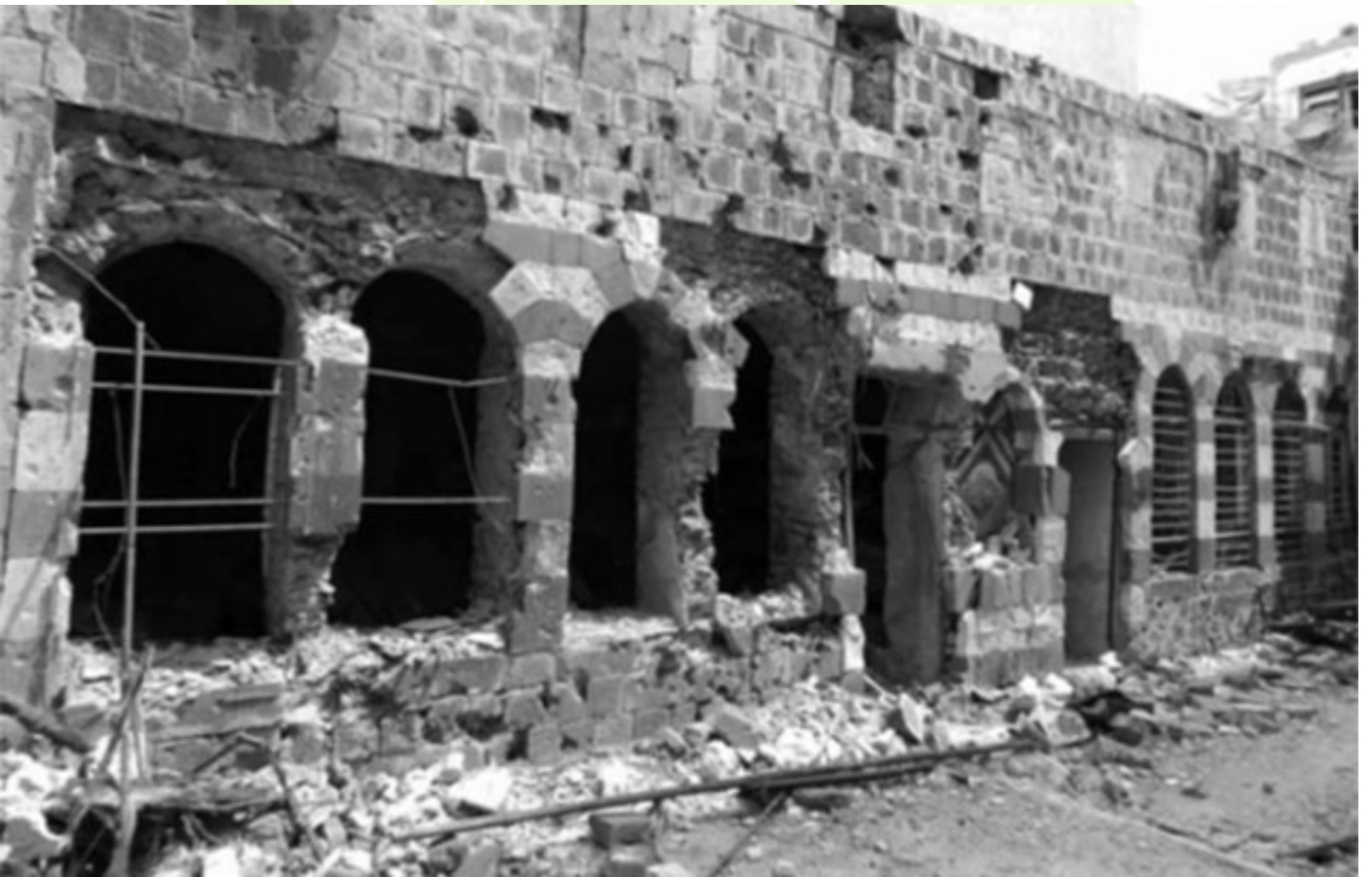
دمار منطقة بابا عمرو. الشكل (1)