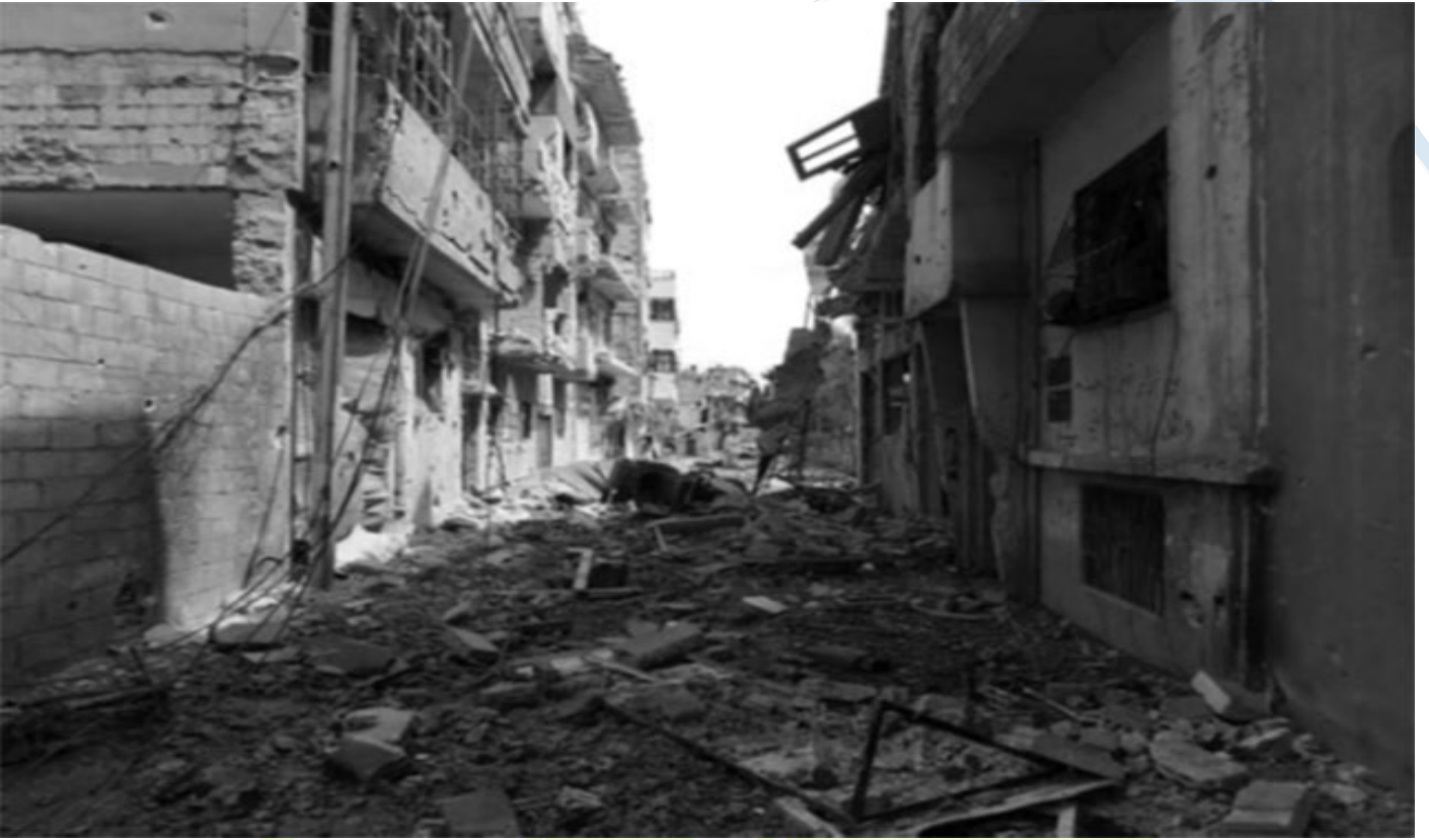
دمار مبني في حمص.